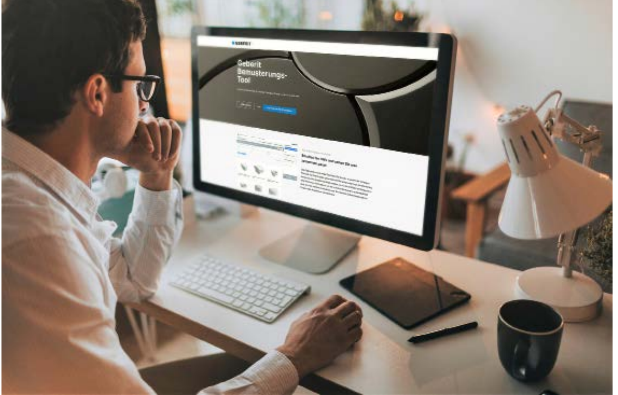
Bild 1 • Das Bemusterungstool ermöglicht Planern und Installateuren eine zeitsparende und vor allem fehlerfreie Bemusterung.