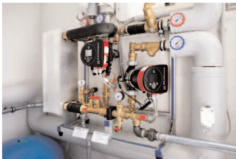
◀ Die Wärmetauscher-Solarstation „Solar XXL“ von Meibes dient der Übertragung der durch Sonnenenergie erzeugten Wärme auf den zentralen Heizungskreislauf.