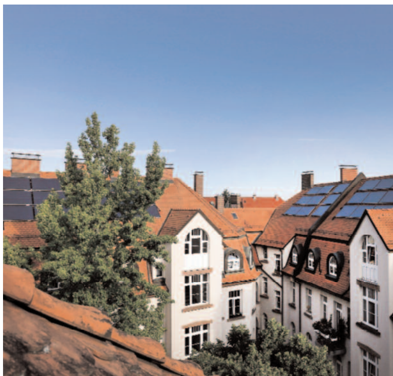
▲ Ein Gründerzeit-Ensemble aus zehn Mehrfamilienhäusern wurde in Freiburg energetisch saniert und im Zuge dessen die Wärmegewinnung auf Solarthermie umgestellt.

Vor der energetischen Sanierung wurden die meisten Wohnungen mit einer Gas-Etagenheizung versorgt, in manchen waren Einzelöfen installiert. Diese sollten durch eine zentrale Wärmeversorgung über ein Mikrowärmenetz unter Einbindung einer großen Solarthermie-Anlage in Verbindung mit einer dezentralen Warmwasserbereitung durch Wohnungsstationen ersetzt werden. Das Netz besteht aus zehn Wärmespeichern mit 1.200 bis