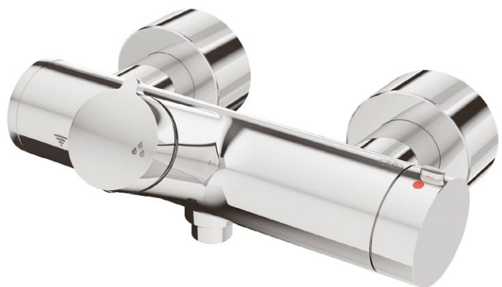
Bild 3 • Beispiel für eine thermostatische Duscharmatur mit mechanischer Begrenzung der maximalen Auslauftemperatur mittels Arretierscheibe auf 38 °C, die nur mit Werkzeug außer Kraft gesetzt werden kann. Eine thermische Desinfektion ist dennoch möglich.

Es besteht also auch hier kein Widerspruch zu den oben zitierten Normen. In Einzelfällen können hier also auch zentrale Durchgangsmischer eingesetzt werden. Grundsätzlich ist jedoch bei Sanitärräumen in öffentlichen und halböffentlichen Bereichen mit Reihenduschanlagen darauf zu achten, dass zentrale Durchgangsmischer gemäß DVGW W 551, Kapitel 5.5.2, oftmals nicht möglich sind. Denn in diesem Arbeitsblatt wird folgende Anwendungsgrenze festgelegt: „Zwischen Durchgangsmischarmaturen und der am weitesten entfernten Entnahmestelle ist das Wasservolumen auf 3 Liter zu begrenzen.“