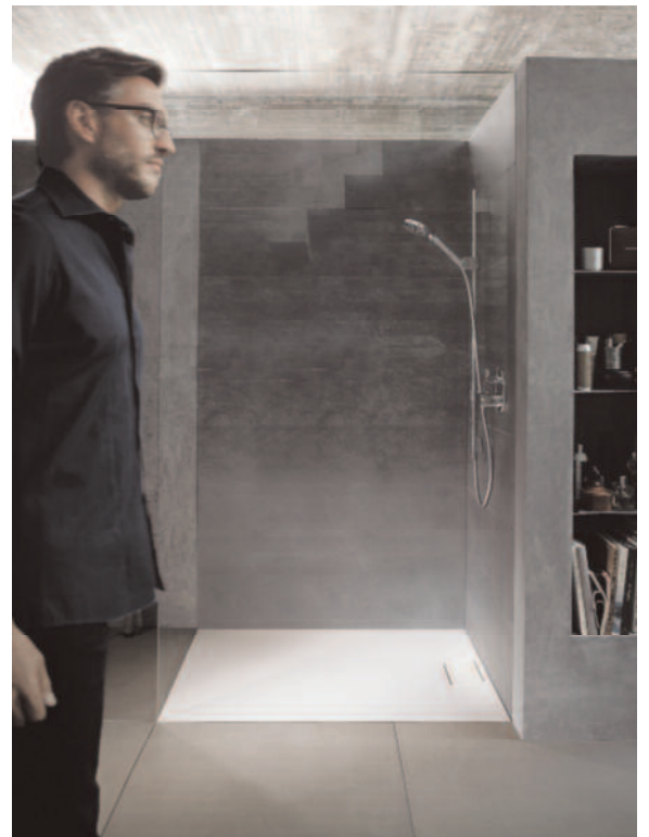
▲ Für höchste ästhetische Ansprüche steht die Duschwanne Stonetto, die aus dem optisch wie haptisch hervorragenden Material DuraSolid Q gefertigt wird.