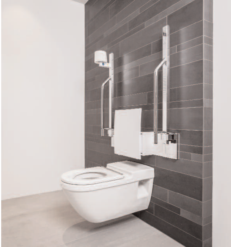
▲ Als Umsetzhilfen empfehlen sich fest verankerte, hochklappbare Stützgriffe mit integrierter Papierrollenhalterung.

erfüllen die Kriterien der DIN 18025/ I + II und 18040-2E für barrierefreie Bäder und gewähren ausreichend Bewegungsfreiheit – auch für eine eventuell erforderliche Hilfsperson.