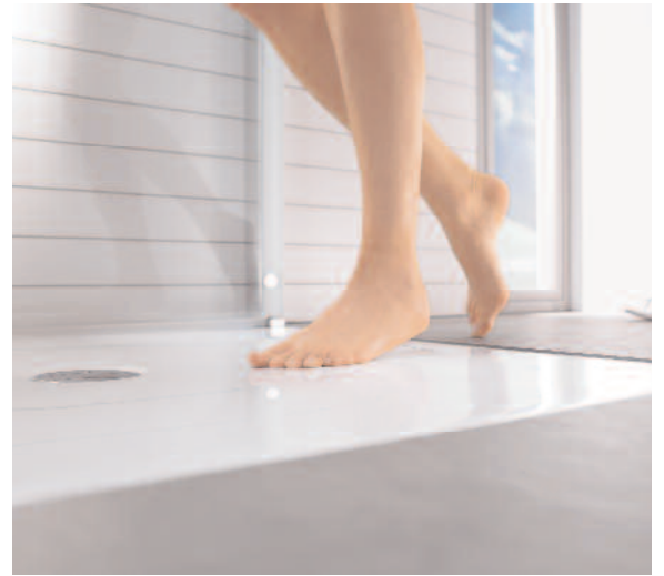
▲ DuraPlan Duschwanne mit rutschhemmender Antislip-Beschichtung aus Sanitäracryl.