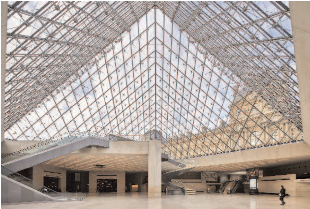
▲ In der Napoleonhalle unterhalb der Pyramide wurde der Informationsschalter ausgelagert, so dass hier nun Licht und Raum dominieren.